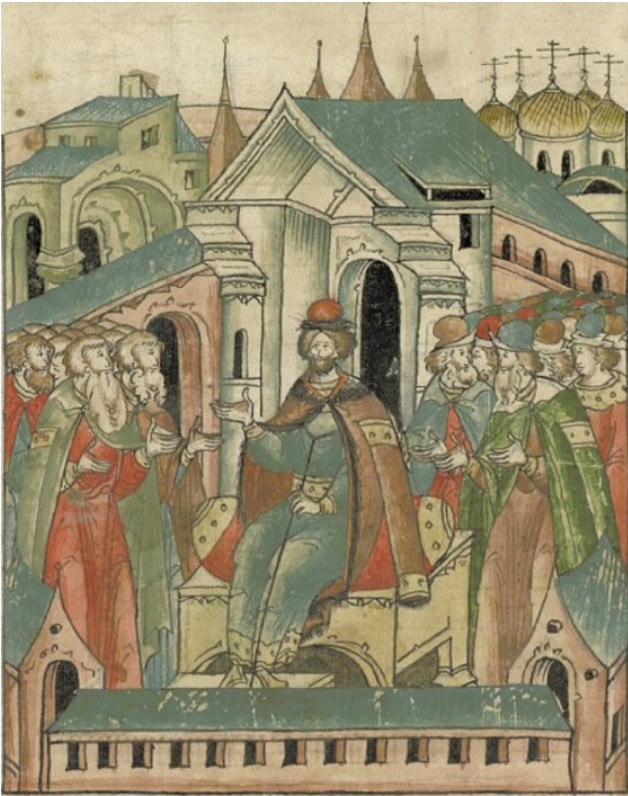
Владимир Мономах на киевском престоле. Миниатюра из Лицевого летописного свода. XVI в.