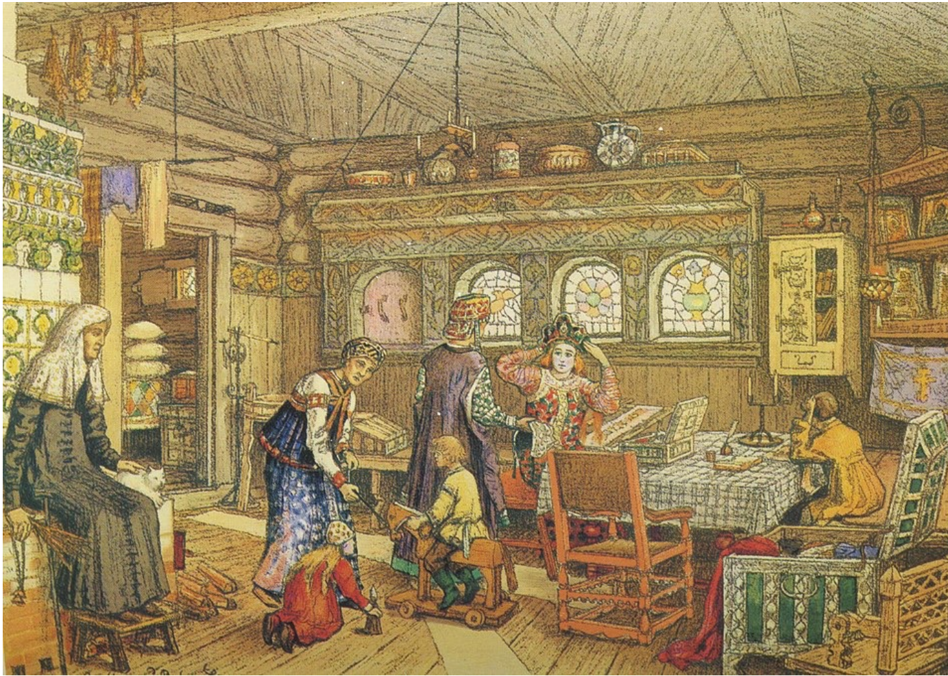
А. Васнецов. В горнице древнерусского дома в Московской Руси. 1908-1909 гг.