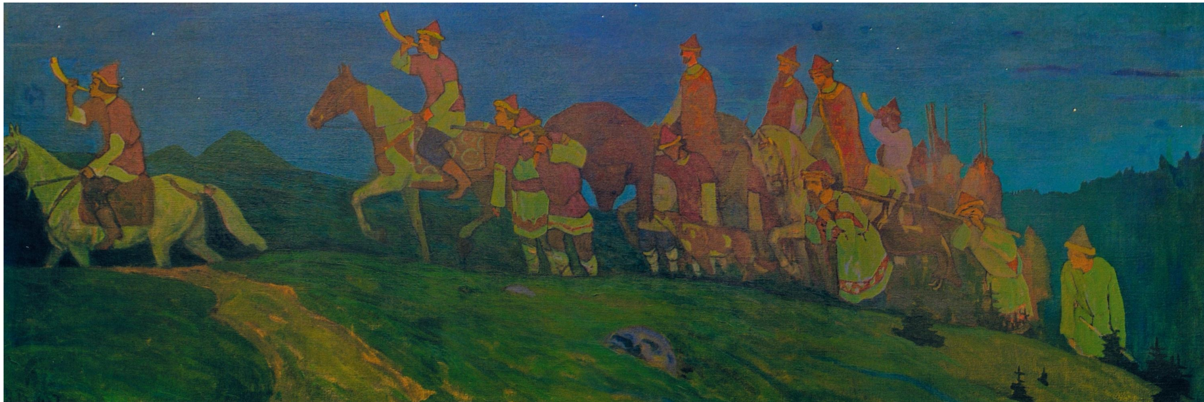
Н. Рерих. Княжая охота. Вечер (Возвращение с охоты). 1901 г.