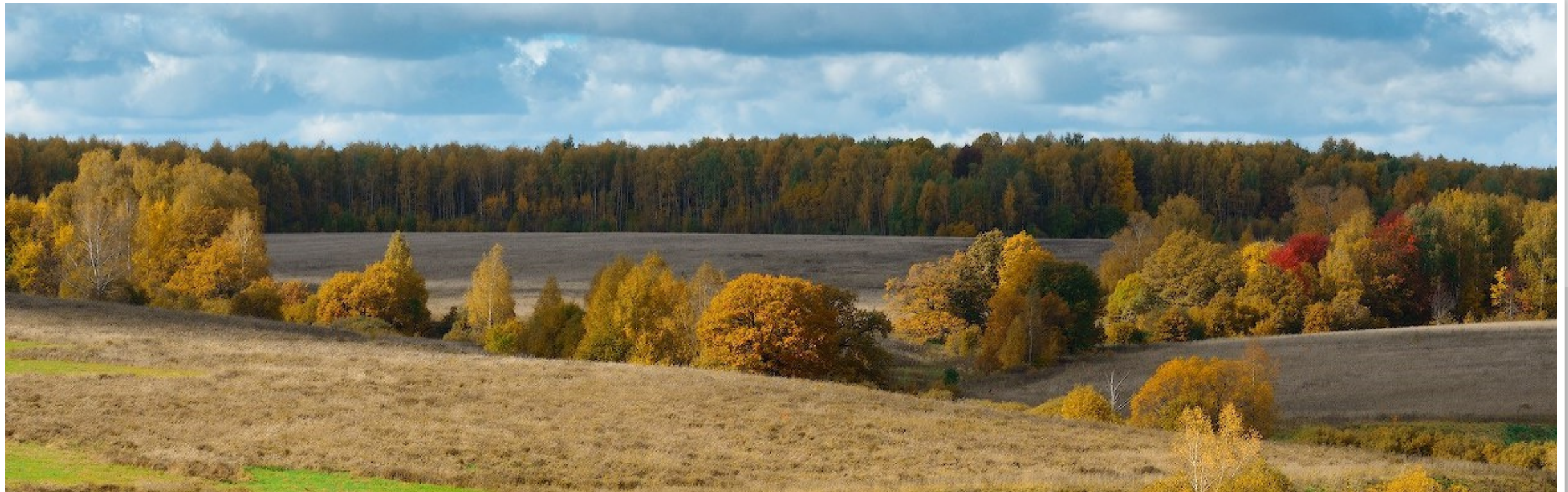
Владимирское ополье. Современная фотография