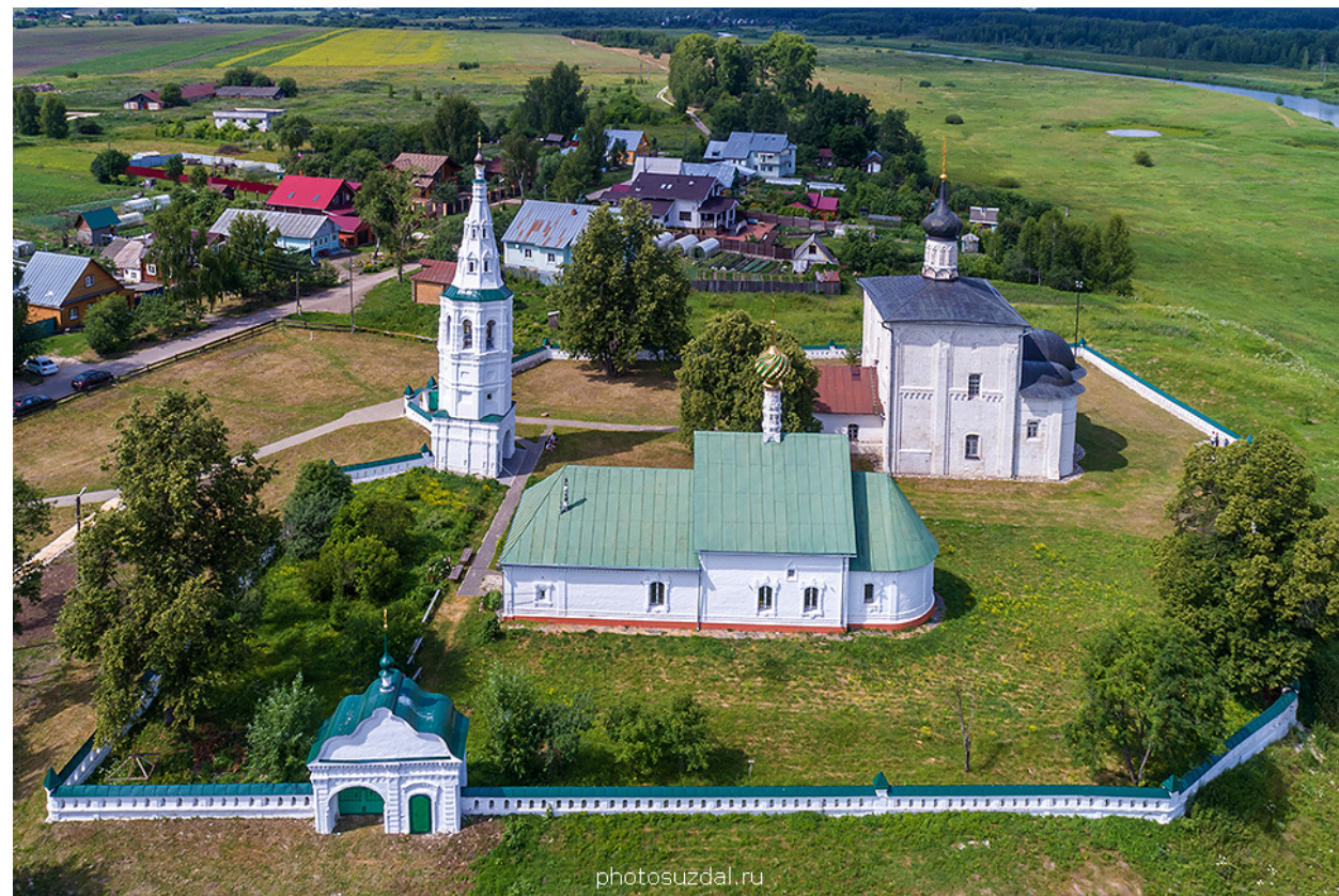
Архитектурный ансамбль в селе Кидекша