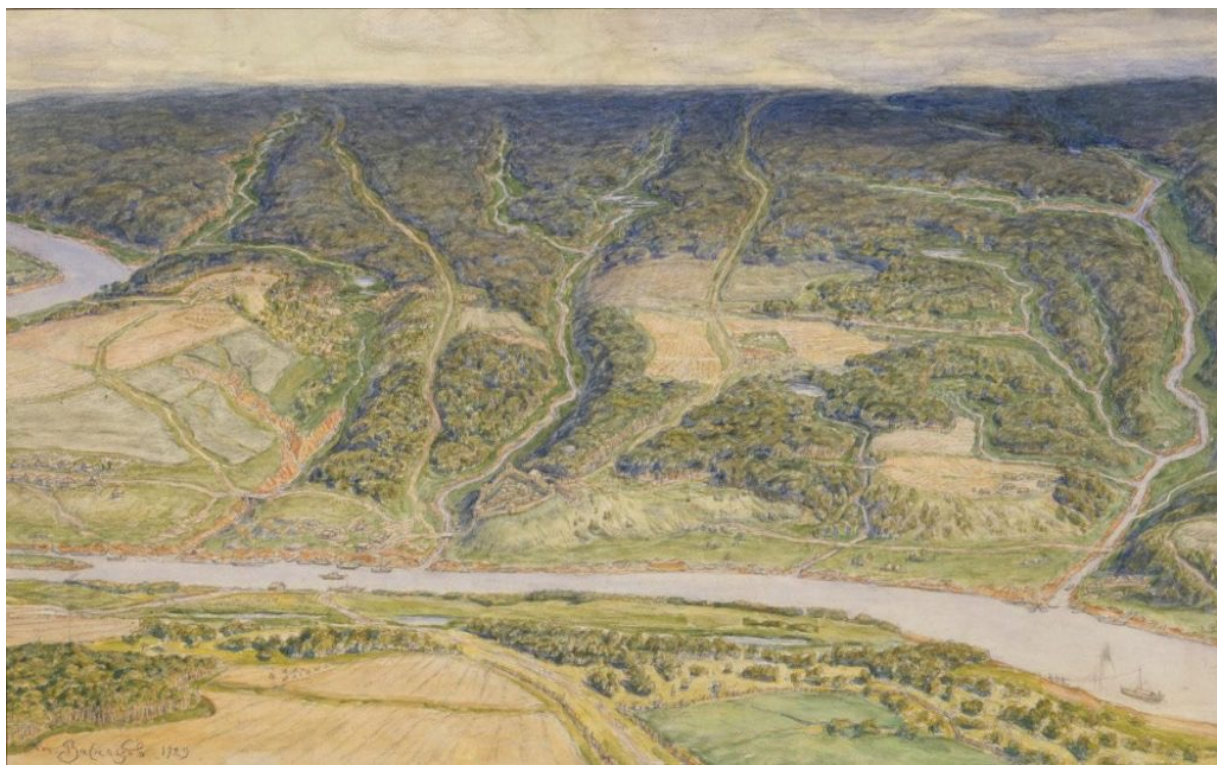
А. Васнецов. Москва — городок и окрестности во второй половине XII века. 1929 г.