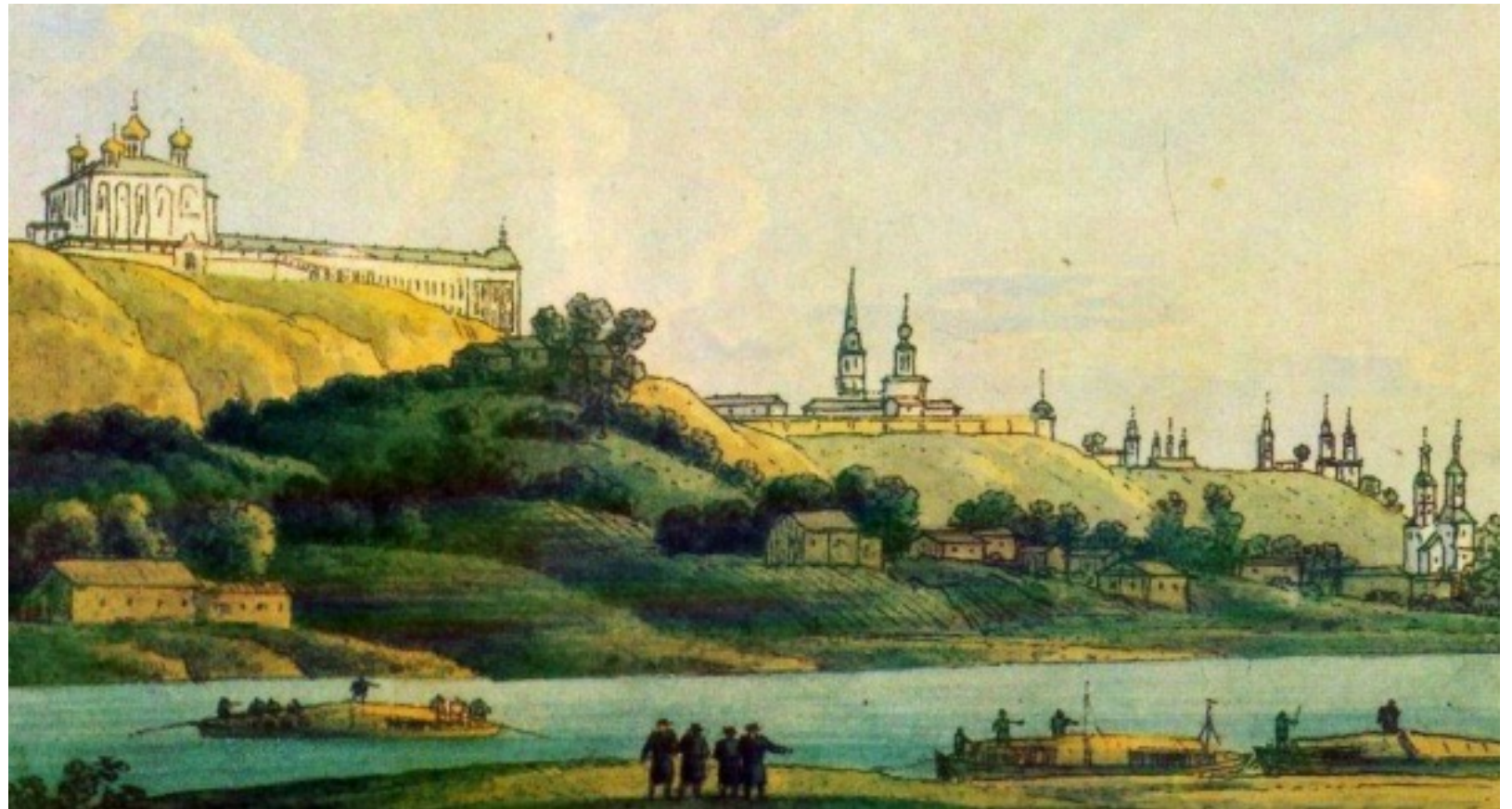
А. Мартынов. Вид Владимира. 1819 г.