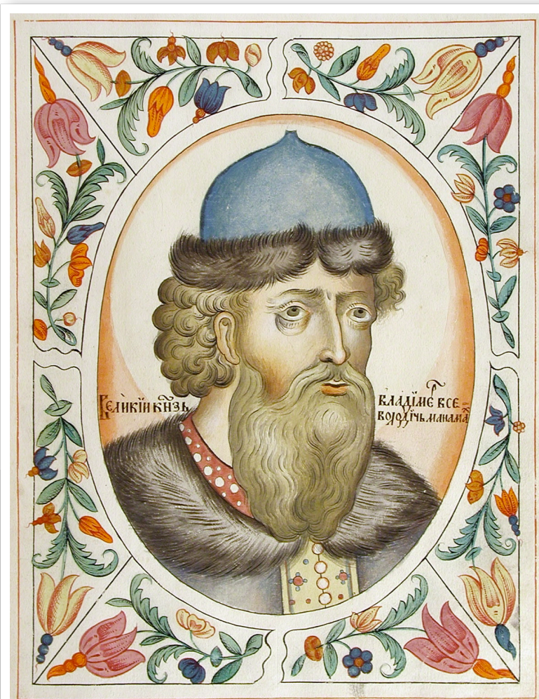
Владимир Мономах (1053–1125 гг.)

Миниатюры из Царского титулярника. 1672 г.