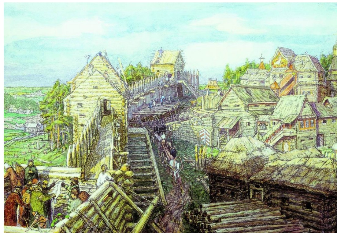
А. Васнецов. Основание Москвы. Постройка первых стен Кремля Юрием Долгоруким в 1156 году. 1917 г.