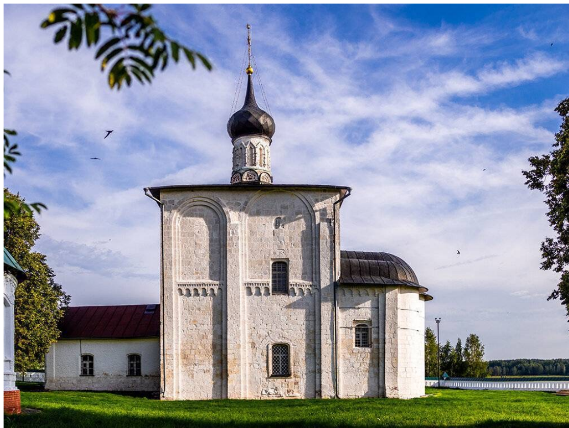
Церковь Бориса и Глеба в Кидекше. 1152 г.