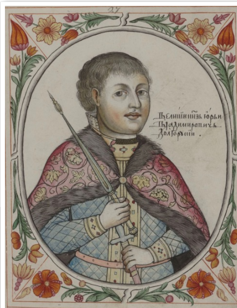
Юрий Долгорукий (1125-1157 гг.)